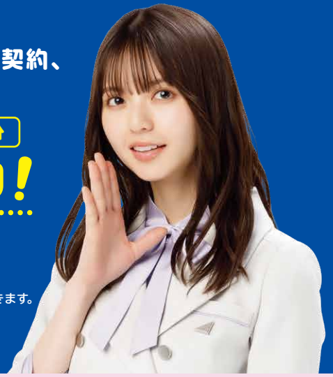
齋藤 飛鳥

期間中、77スマートネクストをご契約、 ご利用いただいたお客さまへ お利息を全額 最大3か月分 キャッシュバック!