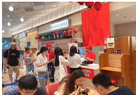
<テストマーケティングスペース>