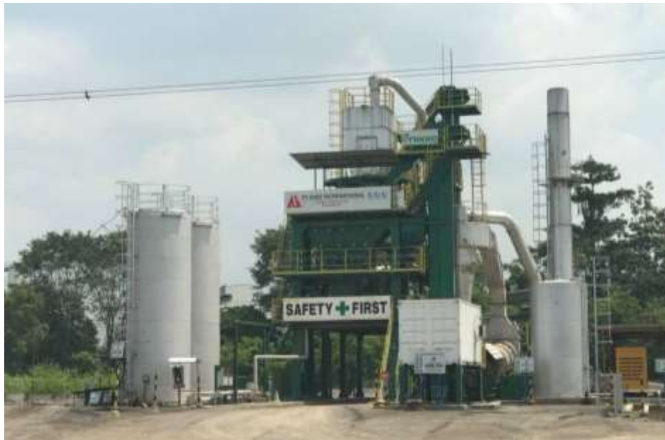
リサイクルアスファルトプラント 1号機 (インドネシア)