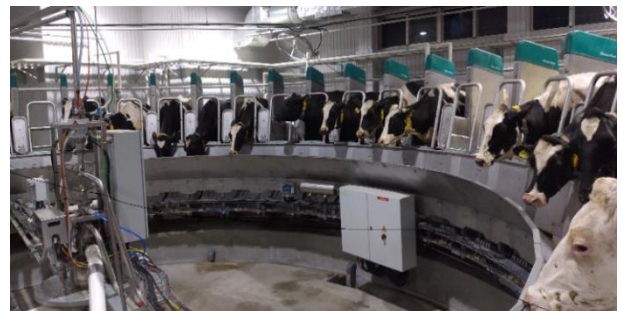
【最新鋭ロボットによる搾乳の様子】