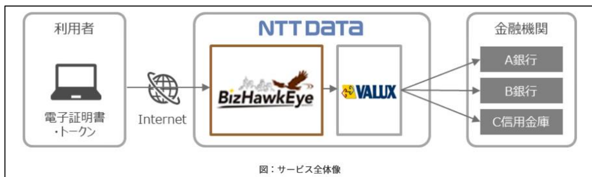
図：サービス全体像

BizHawkEyeとは、NTTデータがEBサービスの利用企業向けに提供するWebサービスです。NTTデータが提供するインターネット経由での回線接続サービス「VALUX（バリュックス）」を通じて、専用のブラウザ画面で、BizHawkEyeを取扱う複数金融機関の口座の明細照会や資金移動取引を一元的に利用することができます（VALUX対応のEBソフトは不要です）。