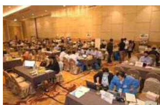
2020年FBCバンコクウェブ商談会の様子