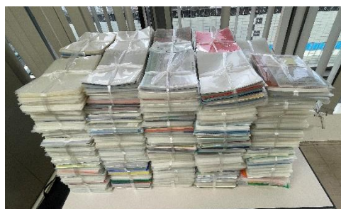
回収したクリアファイル