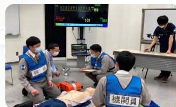
シミュレーション教育