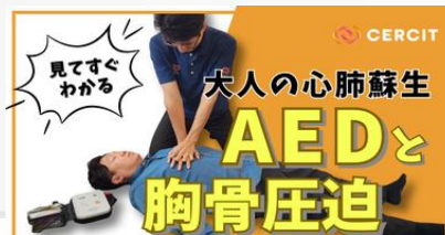
「医療を学ぼう、CERCIT公式チャンネル」 YouTube公式チャンネル