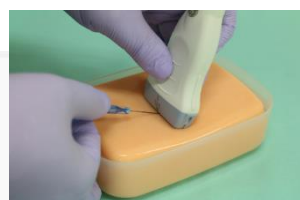
シミュレータの「US-Sensist」 (エコー下穿刺トレーニングモデル)