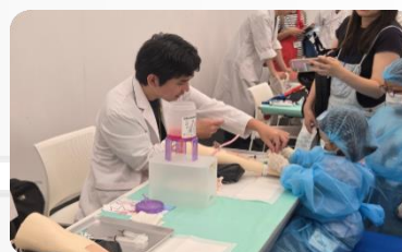
医療体験型イベント