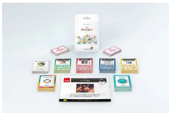
The Action! ~SDGsカードゲーム~ で使用するカードゲームキット

また、「77SDGsコネクトサービス」のほかにも、SDGsへの取組みについて現状診断と対外公表支援をさせていただく「77SDGs支援サービス」や、SDGs関連の目標達成状況に応じて金利を優遇させていただくSDGs定型目標型融資「77SevenGoals」等についても取り扱っておりますので、詳細はお近くの営業店までお問い合わせください。