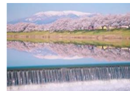
宮城県 一目千本桜

2017年、当行、青森銀行、秋田銀行、岩手銀行、山形銀行、東邦銀行の東北地銀6行と日本政策投資銀行が「観光振興事業への支援に関する業務協力協定」を締結し設立したネットワークです。