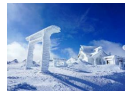
宮城県 刈田岳山頂