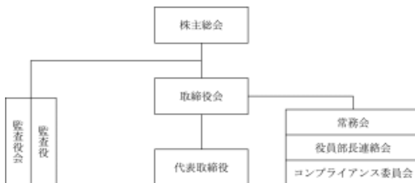
会社の機関の概要

なお、当行は、社外取締役については選任しておりませんが、各取締役間における経営監督機能が果たされているほか、財務・会計、法令、企業統治等についての専門的な知見を有し、公正・独立な立場で業務執行の妥当性等を監視する社外監査役3名を含め、5名の監査役により、客観性及び中立性のある経営監視機能を確保していることから、現状の体制によって各機能は十分に機能しております。