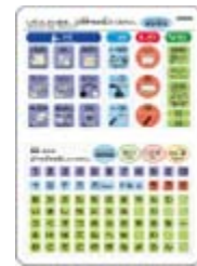
コミュニケーションボード