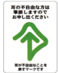
聴覚障がい者誘導表示板